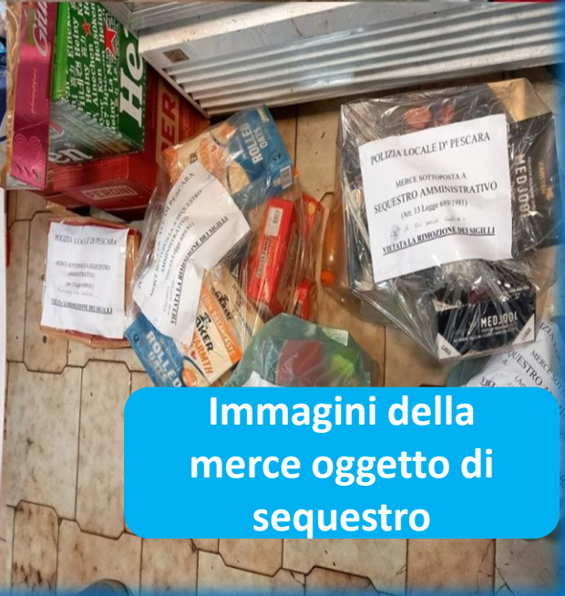
Immagini della merce oggetto di sequestro