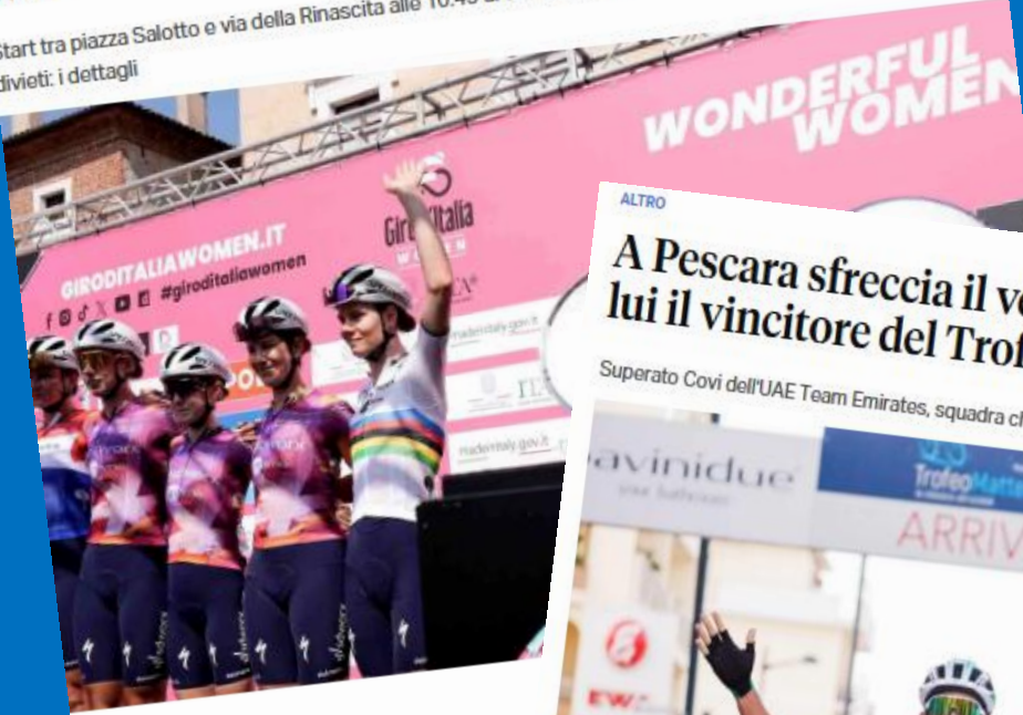
Giro d'Italia Women

Start tra piazza Salotto e via della Rinascita alle 10.45 di domenica 14 luglio e già dal 12 scatteranno i primi divieti: i dettagli