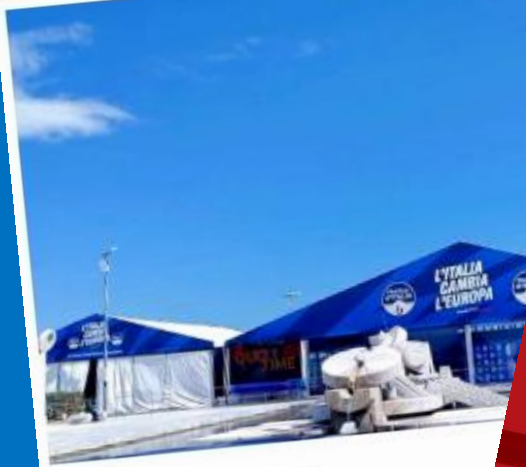
La struttura dove si terrà la convention

La conferenza programmatica del partito della premier Giorgia Meloni è prevista da venerdì 26 a domenica 28 aprile