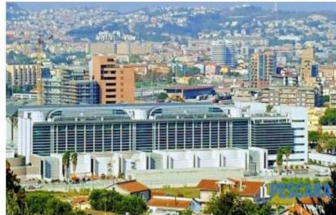
Il tribunale di Pescara

La procura di Pescara sottolinea, nell'ambito dell'inchiesta che ha portato all'arresto di quattro persone per la gestione del noto ristorante, come si confermino legami diretti e indiretti sul territorio pescarese con la criminalità organizzata